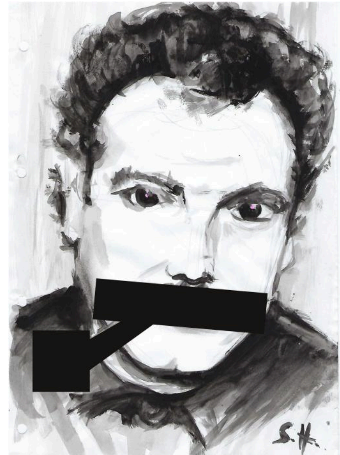
Portrait anonyme de Georges, par Sébastien Houbre

J'ai jamais oublié d'avoir les yeux de ta couleur. Et si parfois j'ai pu plier, Jamais je n'ai repeint mon coeur Couleur des circonstances, couleur de la mode des hommes. Mes yeux toujours ont les nuances des promesses d'un p'tit bonhomme.